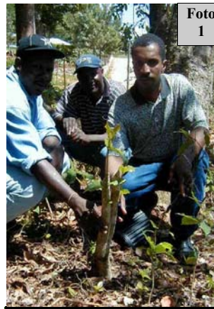
Pye kafe te taye kareman

Dyagram B a montre griy plantasyon sa. Si yo plante konsa, chak kawo tè gen 3225 pye kafe. Pour range jaden konsa plantè dwe itilize kèk kòd byen long pou yo ka etabli mòd plantasyon sa nan jaden yo. Apre, yo ta wete o swa ajoute plan kafe kote ki bezwen sa, pou yo ka swiv modèl sa nan jaden yo. Pou sa ka fèt, li pwobab fòk yo deplase kèk plan ki pa nan bon liy pou mete yo nan bon pozisyon nan ran selon modèl la. Deplase plan kafe se yon bagay ki fasil. Pandan sezon lapli, jenn